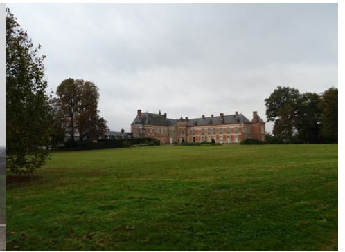
Les deux ailes en équerre (vues de l'est)