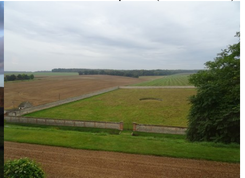
L'enclot du potager depuis le château

Pour la zone en violet-rose dans le périmètre de 500m et au-delà