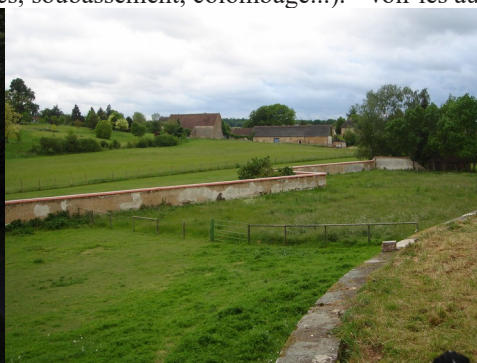
Des prairies et une ferme voisine