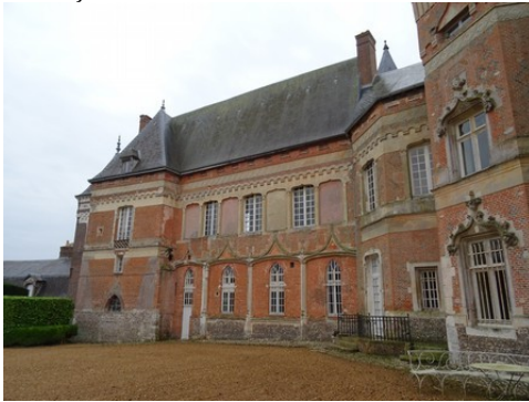
Les décors gothiques du XIXe siècle