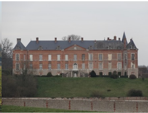
La façade ouest (vue rapprochée)