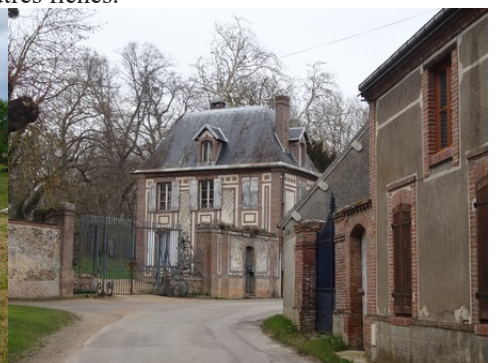
Le bâti rural alentour