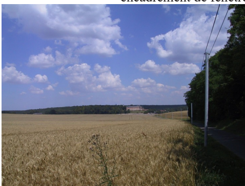
Les champs autour du domaine

Les avis seront cohérents avec ceux émis ces dernières années, à savoir : pas de maisons à volume compliqué (type V, W, Y, ou Z), pentes à 45° pour les volumes principaux, ardoise ou tuile plate de teinte brun vieilli, à 20u/m 2 , avec un débord de toiture de 20cm, enduit de teinte beige clair avec modénatures (au choix : chaînages, encadrement de fenêtres, soubassement, colombage...). *Voir les autres fiches.