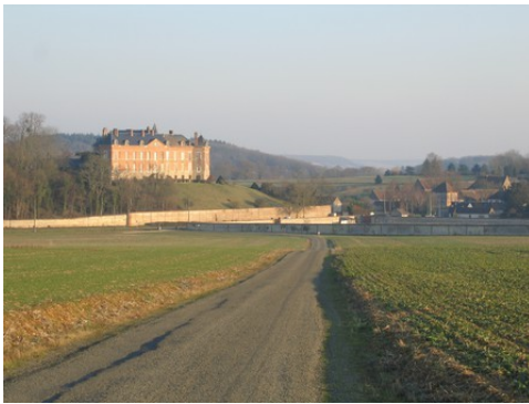
La façade ouest du château