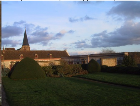
La ferme modèle et les communs